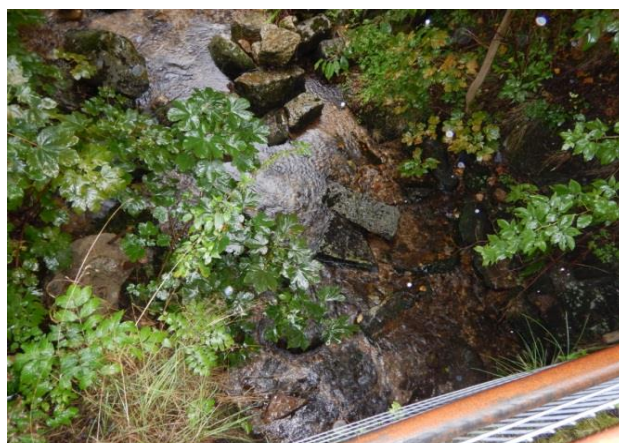
Koryto v místě kritického bodu