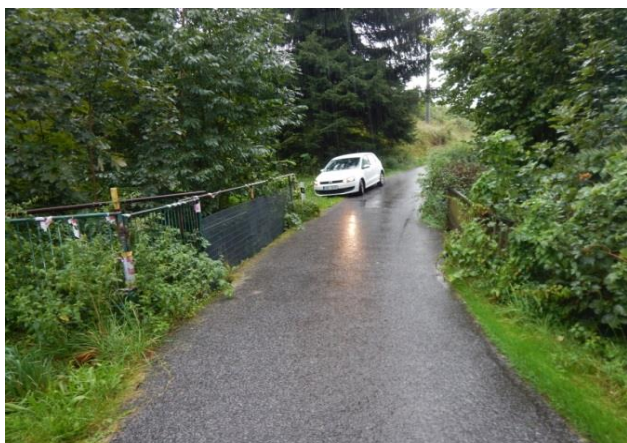
Mostek nad Malou Jeřicí

Mostek místní silnice přes Malou Jeřici zhruba v polovině jejího povodí je kapacitní a přilehlé budovy nejsou ohroženy. Nad KB se však nachází další mostek poškozený povodněmi v roce 2010 i v roce 2013.